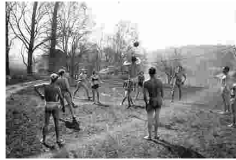
1936 - Volley ball sur les bords de Seine