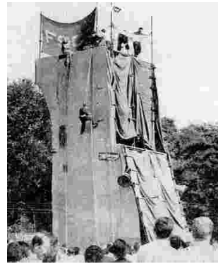
1955 - Fête de l'Huma Première tour d'escalade