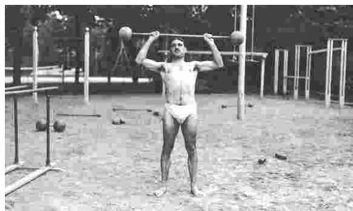
1903 - Stade Jean BOUIN - UASG

Plusieurs petits groupes étaient invités à "deviner" la légende de différentes photos de la FSGT. Un moyen ludique de parler de la fédération et de ses combats pour le sport ouvrier puis populaire depuis 80 ans. Chaque image a toujours une fonction et un message à délivrer.