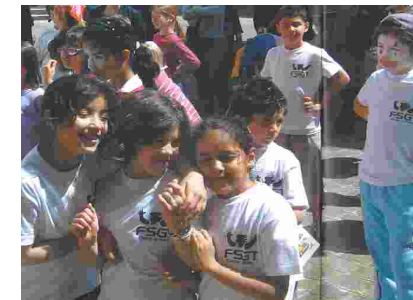
Tour de Buttes Chaumont Initiative populaire omnisport Depuis 1984