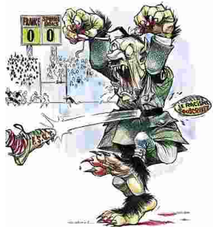
La FSGT contre l'apartheid en Afrique du sud