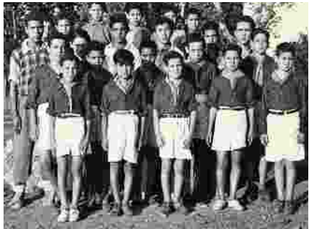
La FSGT et l'Algérie (Section de Blida)