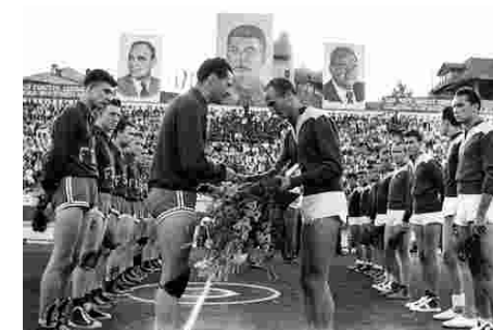
1952 Bucarest - Rencontre de basket