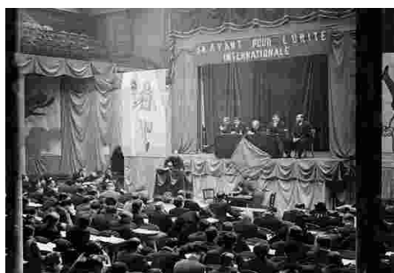
24 décembre 1934 Rue de la Grange aux Belles 75010 Paris Congrès de fusion À l'unanimité les délégués de la FST et de l'USSGT décident de créer la FSGT