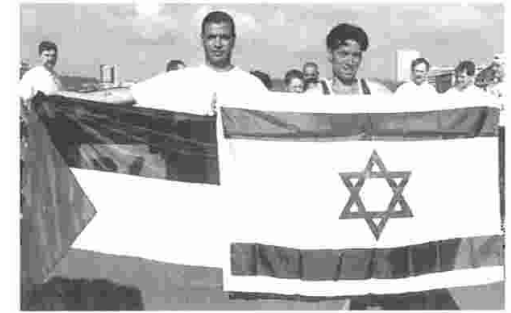
Course pour la Paix entre sportifs palestiniens et israéliens