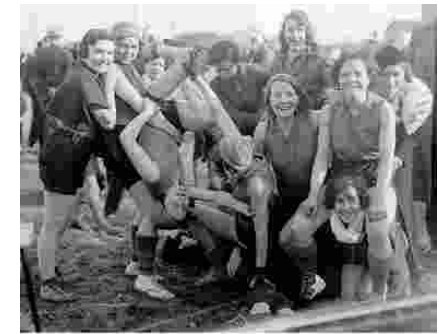
1936 - Les filles de l'Étoile Rouge