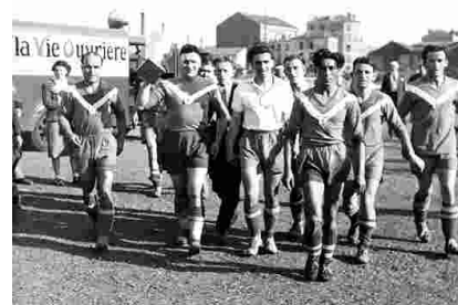
1950 - Finale de la coupe de la VO organisée par la FSGT