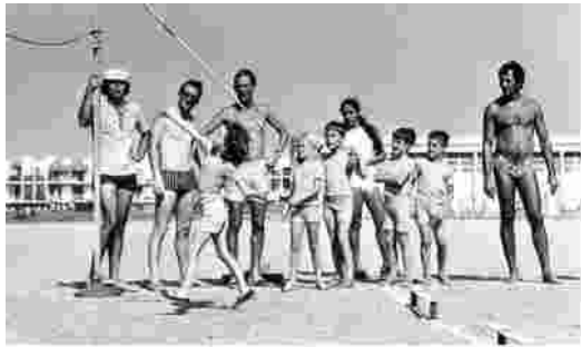
Stage Maurice BAQUET à Sète 1970