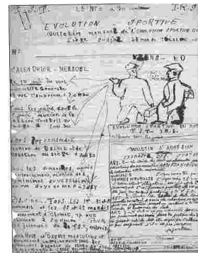
Petit journal de l'ES 15 qui deviendra l'ESC15 Grand club historique FSGT du comité de 105 ans