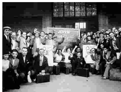
Paris 1936 Départ de la délégation FSGT pour l'Olympiade populaire de Barcelone