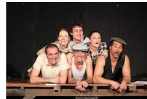
Les comédiens pendant les répétitions

Mais ils ne nous convient pas seulement pour bouffer des cacahuètes : non ! C'est aussi pour y entendre une pièce de théâtre qui fait revivre quelques-uns des moments clef de cette extraordinaire aventure humaine.