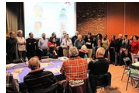
Les candidats devant leurs « électeurs »

Par rapport à la saison précédente, on remarque une diminution du nombre de pratiquants en foot à 11 et à 7 de l'ordre de 100 et 150 licenciés respectivement. En revanche, on constate une augmentation du nombre de licenciés en escalade de l'ordre de 250 licences. Les autres activités sont stables avec peu de pertes ou d'augmentation de licenciés.