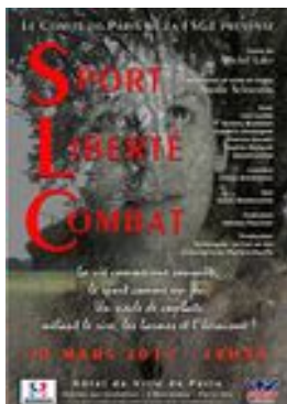
L'affiche du spectacle