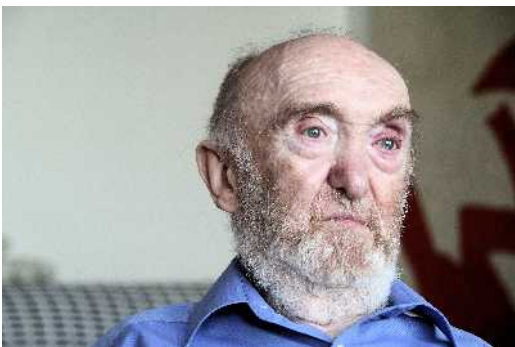
Albert Jacquard chez lui le 18/04/2013

Ce scientifique avait le talent de nous faire comprendre, avec discrétion mais fermeté, les sujets de société les plus ardues. Par de mots simples et précis, de sa voix monocorde qui forçait l'écoute, il distillait ses vérités sans emphase en véritable humaniste qu'il était. Nous sommes nombreux à lui rendre hommage.