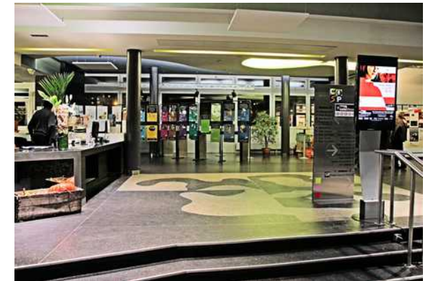
L'accueil du CISP