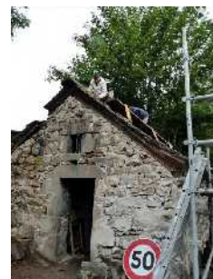
Travaux de restauration de l'ancien four.

Renseignements complémentaires : association-tikjda@wanadoo.fr