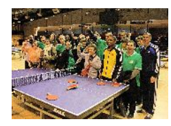
Association pour l'insertion et la réinsertion professionnelle et humaine des handicapés (ANRH)