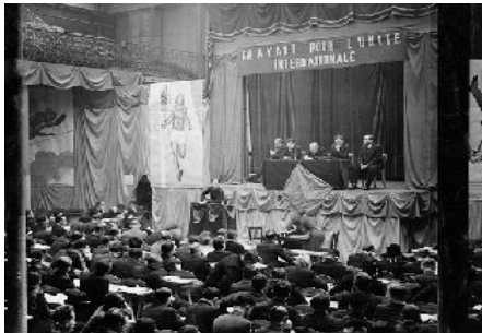
24 décembre 1934 à Paris Création de la FSGT

Un bel hommage est ensuite rendu aux caricaturistes du monde entier avec une projection d'une série de dessins réalisés par des militants du Comité sur la FSGT et ses activités sportives.