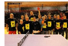
Association d'Action et d'Insertion Sociale (ANAIS)

Deux équipes parmi les associations regroupées au sein de l'ESAT (Établissements et services d'aide par le travail)