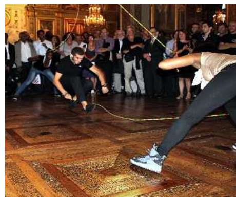
Démonstration de double dutch