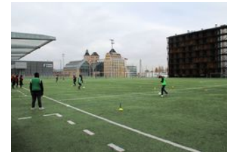
Terrains de football