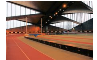
Stade d'athlétisme (la Pagode)

Le Comité de Paris est totalement impliqué dans l'organisation de ce Festival, en partenariat avec la fédération, la ligue et tous les comités IDF/FSGT. Comme il l'avait fait lors de la Caravane du sport populaire en mai dernier sur le parvis de l'Hôtel de ville, il souhaite que cet événement soit une occasion supplémentaire de rencontres et de solidarité entre bénévoles des clubs FSGT de Paris.