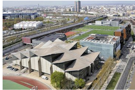
Vue aérienne du Centre sportif

Il se déroulera les 3, 4 et 5 juin 2016 au Centre sportif Jules Ladoumègue 75019 (Porte de Pantin).