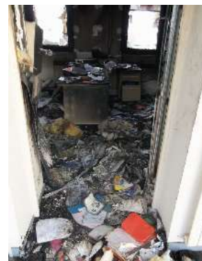
Ce qui reste après l'incendie !