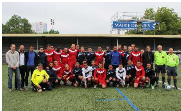
Avant la finale de la coupe Delaune

Preuve que dans l'univers du football nous pouvons encore organiser des épreuves sportives centrées sur la rencontre, l'échange et la convivialité tout en permettant d'offrir un espace de pratique de haut niveau.