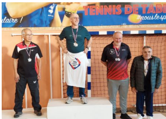
Le podium de la 5 e série

Le Comité de Paris grâce à ces 2 clubs, le CPS10 et l'ASCE, a remporté 5 titres de Champion de France. Un immense bravo à tous !